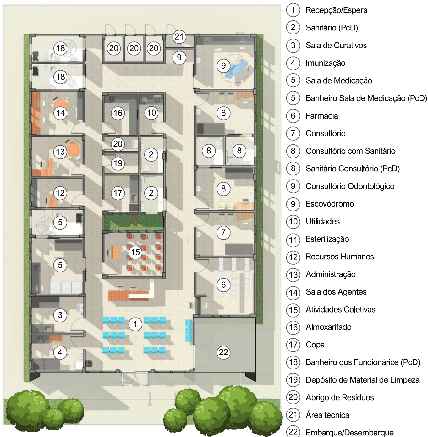
Figura 3 – Esquema para melhor compreensão da distribuição interna dos ambientes.