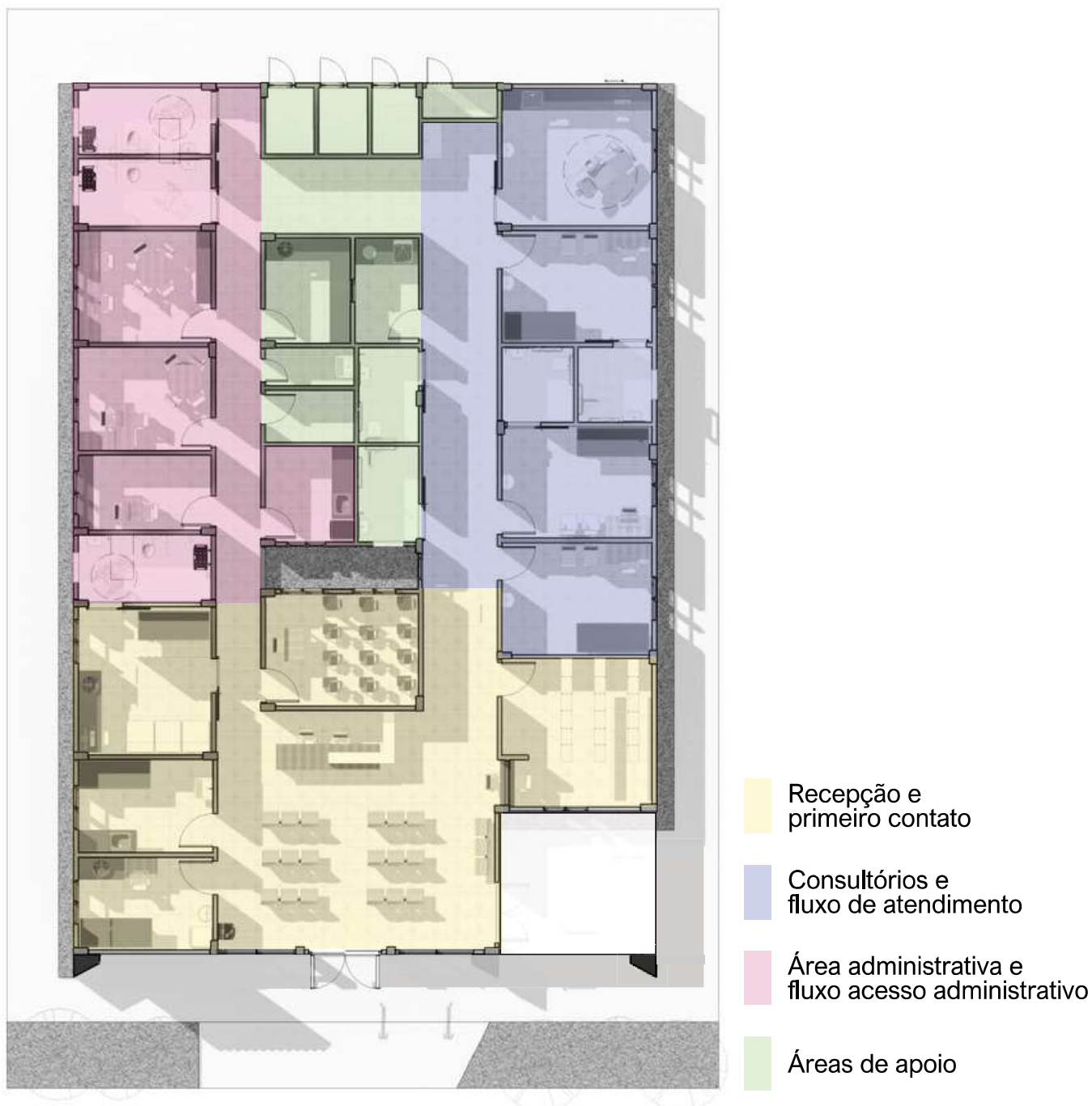
Figura 4 – Esquema para melhor compreensão do fluxo e distribuição setorizada da unidade.